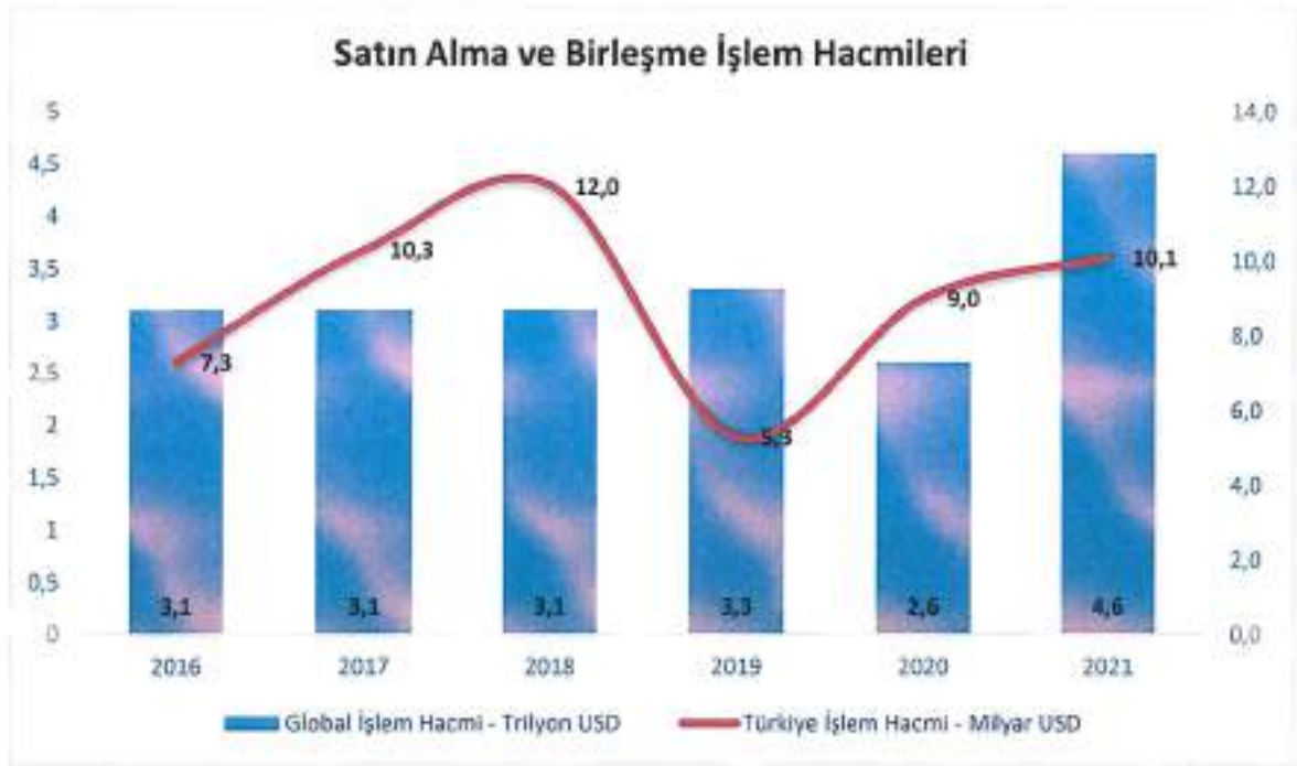
Şekil 2 : M&A İşlem Hacimleri

Türkiye'deki toplam satın alma ve birleşme pazarında, işlem hacmi 2020 yılında 9 milyar USD olarak gerçekleşirken, 2021 yılında %12,2 oranında artış ile 10,1 milyar USD olarak gerçekleşmiştir. İşlemlere ilişkin detay tablo aşağıda yer almaktadır.