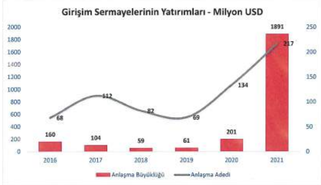
Şekil 5: Girişim Sermayelerinin M&A İşlemleri

Amerika'dan gelen yatırımcılar, toplam yabancı yatırımcıların işlem değerinin %62'sini ve işlem sayısının %37'sini oluşturmuştur.