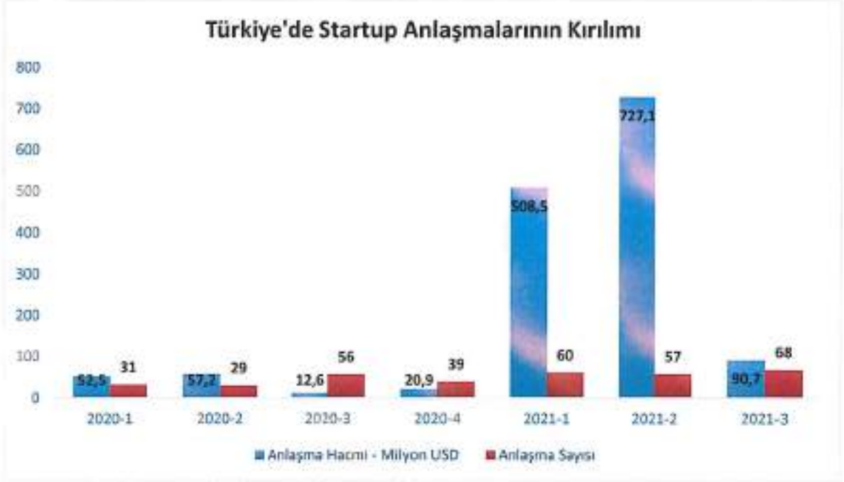
Şekil 1 : Türkiye’de Startup Anlaşmalarının Kırılımı

Startup yatırımlarının yıllara göre hacim ve işlem sayılarını gösterir grafik aşağıdaki gibidir.